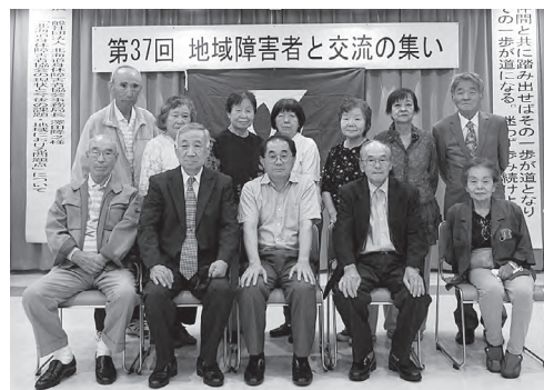
参加者のみなさんと記念撮影!

この事業は、北竜町や秩父別町と合同で行う予定でしたが、お祭りや行事などの関係もあり、今回は深川身障協会単独の開催となりました。今後、市の協会と町村の協会が連携して行う事業などには、北身協が間に入って調整するなど積極的に関わっていききたいと思えます。