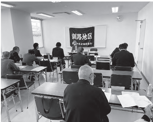
理事会・総会の様子

その後、令和4年度事業報告及び収支決算報告、令和4年度会計監査報告、令和5年度事業計画及び収支予算、会長表彰について、議案どおり承認されました。