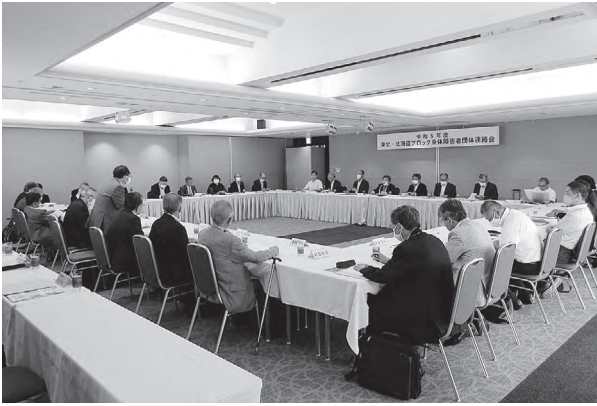
東北・北海道各地から36名の出席者でした。

令和5年7月6日(木)、北海道札幌市において、東北・北海道ブロック身体障害者団体連絡会を北海道身体障害者協会が当番で開催し、当協会から理事9名と監事2名のほか、事務局3名が出席しました。