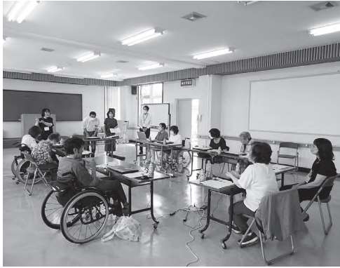
手話通訳の方も含め、多数の参加者でした。

1日目は、講師の先生が作ってきたくれた資料を参考にパソコンの基本操作について学び、2日目は、1日目に学んだことを生かしてハガキの宛名や文面づくりをしました。