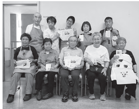
仲間や友達を誘って、楽しいひと時。

7月24日(月)・25日(火)に、石狩市総合保健福祉センターで、障害者パソコン教室を開催しました。