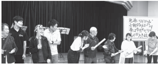
「ブームワッカー」の演奏

校内を見学する際は、学生と一緒にゆつくりと歩き、優しい配慮に参加者の顔もほころび、広い学内を楽しく見学できました。 見学後、講堂にて学生たちがトーンチャイム(ハンドベルの一種)の演奏を披露してくれました。また、手話を取り入れた演奏やブームワッカー(調律されたカラフルなプラスチックチューブを叩いて音を出すことができる楽器)を一緒に演奏し、笑顔あふれる研修となりました。