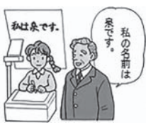
私の会費は... 必要です。 必要です。

平成28年12月より北海道では要約筆記者の公的派遣事業がスタートしました。中途失聴者・難聴者の方が会議や講演会等に出席される際に、コミュニケーションや情報保障を行うための事業です。