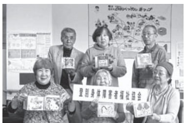
登別教室参加者の皆様

作品作り以外にも、案内文書の作成など、興味のあることに積極的に取り組んでいました。