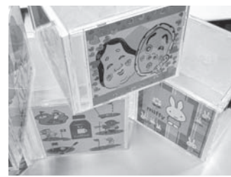
画像を入れたCDケース4枚を接着します。

今年度の障がい者向けパソコン教室では、変哲のない花瓶をより豪華に見せるため、また室内をより華やかにするための、CDケースを利用した花瓶及び花器等のカバーを作成しています。