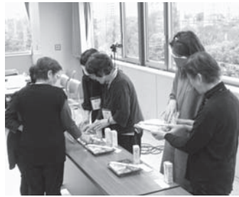
盲ろう者役の受講者にお弁当の説明中

9月末に開講した「盲ろう者通訳・介助員現任研修」では、養成講座で学んだことを復習しながら、エレベーターやトイレの介助や食事実習等、実際の介助の場面を意識した実習が行われています。