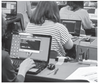
よく使う語句などを事前に登録し、速く変換できるようにします。

8月末に開講した「要約筆記者養成講座」では、手書きコース・パソコンコースとも、実践的な実技の練習が行われていきます。手書き文字の書き方や話された内容のまとめ方など、講師の指導を受けながら参加者同士で交流し合い、技術を高めつつあります。