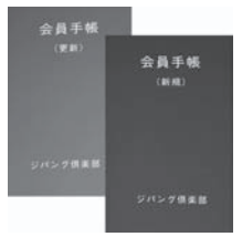
会員手帳(左:色は緑)と更新手帳(右:色は赤)