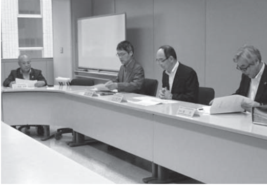
運営委員会の様子

6月20日(水)道民活動センタービルにおいて、今年度の道新コスモス奨学金運営委員会が開催され、6名の委員が出席しました。