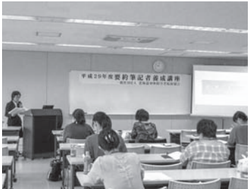
今年度の要約筆記者養成講座の様子