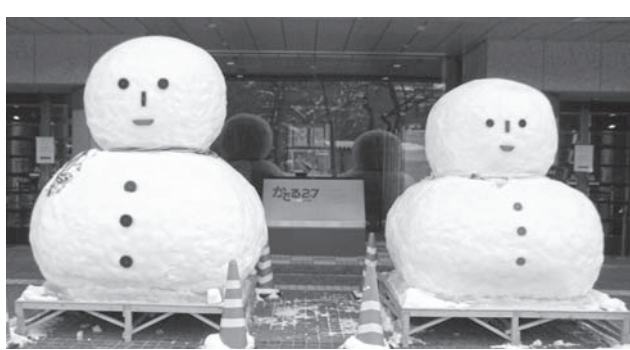
北の風物詩「雪だるま」毎年、雪まつりの期間に事務所の玄関前に鎮座しています。

2月5日(月)より12日(月)まで「さつぽろ雪まつり」が開催され、市内大通会場はじめ各会場は国際色豊かな観光客で大賑わいでした。 特に今年は北海道と命名されて150年とあり、四季を通じて大きな催しが開催されることでしょう。