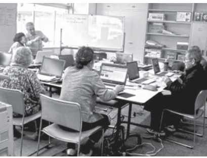
昨年は「ティッシュボックス作り」 今年のテーマは・・・お楽しみに！