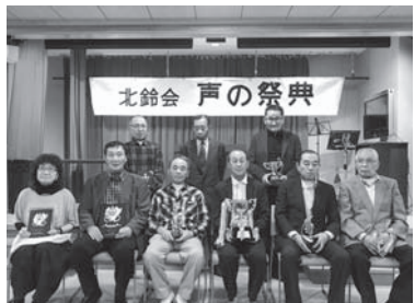
受賞された皆さん

平成29年9月19日、札幌市駒岡保養所で北鈴会声の祭典、発声コンクールが開催されました。