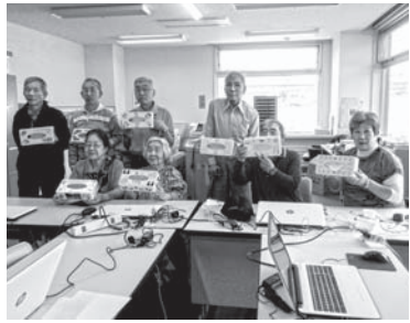
完成品を手にとってハイポーズ

登別教室 10月3日(火)〜5日(木)の三日間、登別市総合福祉センター「しんた21」にて、開催しました。延べ21名の参加があり、今年度の課題「オリジナルティッシュボックスケース」の作成に取り組みました。