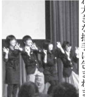
石狩翔陽高校の皆さん