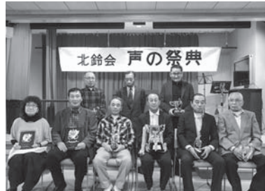
受賞された皆さん