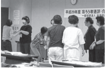
盲ろう者疑似体験中

午後からは、アイマスクと耳栓、ヘッドフォン等を使って、疑似的に盲ろう者となり、講義室の中を非盲ろう者役の受講者に手を引かれ移動しました。受講者からは「見えない、聞こえない状態