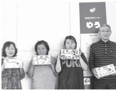
砂川教室参加者の皆さん

テキストシユボックススケープ以外には、来年度のカレンダーや入院履歴の一覧表を作りました。