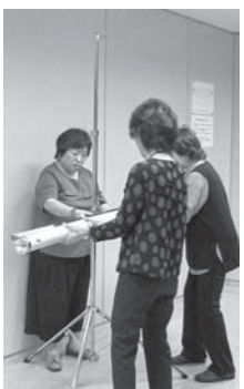
機材の使い方も学びます

午前中から「要約実践技術実習」と題して実技講習が行われ、午後からは、パソコングループと手書きグループに分かれての講義と実習でした。パソコングループでは、パソコンの設定方法やキーボードなどの使用機材の説明、手書きグループでは、実際の現場で使うロール紙を使った三人一組での実習が行われました。