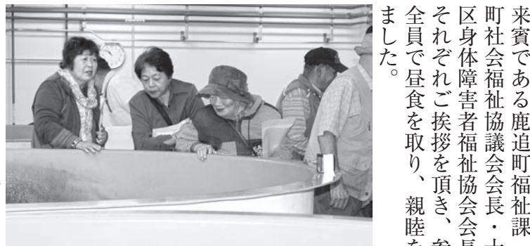
チヨウザメ飼育用水槽のぞき込む参加者の皆さん

午後からは遊覧船に乗船。全員で乗船し然別湖の歴史や風土、昔話など様々な湖に関する説明を聞きました。十勝北3町で楽しい研修となりました。