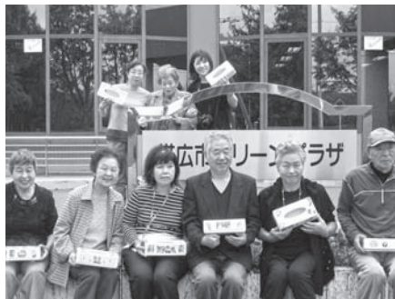
会場の帯広グリーンプラザの前で

開催地の帯広身体障害者福祉協会並びに十勝地区身体障害者福祉協会の皆様のご高配とご協力に感謝申し上げます。