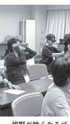
視野が狭くなるゴーグルを使って弱視障害を疑似体験

午後からは、アイマスクと耳栓、ヘッドフォン等を使って、疑似的に盲ろう者となり、講義室の中を非盲ろう者役の受講者に手を引かれ移動しました。受講者からは「見えない、聞こえない状態