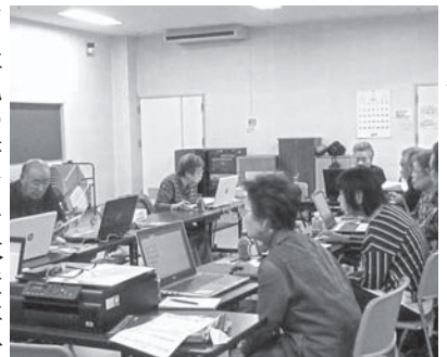
真剣な表情で画面に見入る皆さん

9月12日(火)～9月14日(木)の三日間、帯広市の帯広グリーンプラザにて、開催しました。参加者は延べ22名で、「オリジナルテキスト」の作成では、秋らしいイラストをふんだんに取り入れたり、ご自身の幼い頃の写真を貼り付けたり、個性あふれる作品作りを楽しみました。