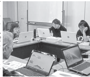
まずは好きなイラストを探るところから

9月5日(火)～7日(木)の三日間、砂川市地域交流センター「ゆう」にて、開催しました。延べ12名の参加があり、今年度の課題「オリジナルテキスト」の作成に取り組みました。