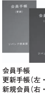
会員手帳 更新手帳(左・色は緑)と 新規会員(右・色は赤)

▼ジパング手帳の到着は、お申込から2～3週間程度の時間が必要となりますので、予めご了承ください。