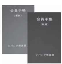
会員手帳更新手帳(左・色は緑)と新規会員(右・色は赤)

弁護士相談(弁護士相談) 月1回(原則として第4週の火曜日)、定例相談として弁護士による専門相談・助言を行います。 弁護士相談を希望される場合は事前予約が必要で、その際、相談概要のほか、住所、氏名、連絡先などが必要となります。(相談の秘密は固く守ります。) 主な相談 ・法律に関する相談 例え、身体・生命に関する相談、財産に対する侵害、相続関係、金融消費・契約関係、雇用・勤務条件関係等 ・人権擁護に関する相談 例え、職場・施設・隣人・知人・家族・親族との人権に関するトラブル ・その他必要な相談 受付・お問合せは 電話 011(252) 1233 3 FAX 011(252) 1233 5