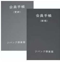
会員手帳 更新手帳(左・色は緑)と新規会員(右・色は赤)

▼ 入会資格 身体障害者手帳をお持ちの男性60歳・女性55歳以上の方は ▼ 年会費 一人 1,350円 (入会金はありません)