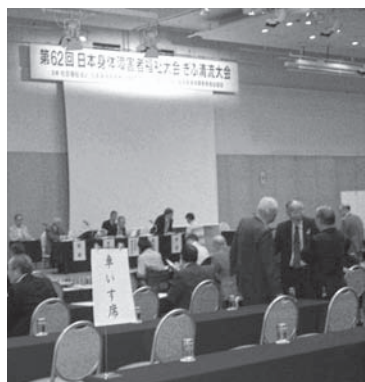
評議員会会場の様子

【一日目】 岐阜都ホテル ボールルーム 10時~12時 日身連評議員会 13時~14時05分 基調講演「ユニバーサルデザイン2020行動計画」について 14時20分~16時30分 シンポジウム「ユニバーサルデザイン2020行動計画がめざす共生社会と障害者団体の役割について」 17時~18時 施設見学(岐阜県福祉友愛プール) 18時30分~20時30分 歓迎レセプション