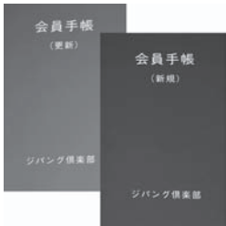
会員手帳 更新手帳(左・色は緑)と 新規会員(右・色は赤)

尚、更新手続きは1ヶ月前か ら可能です。期限を過ぎますと 新規会員扱いになりますので、 早めの更新手続きをお願いしま す。