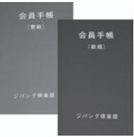
会員手帳 更新手帳(左・色は緑)と 新規会員(右・色は赤)

新規会員 【初回】3回目～2割引 【4回目】20回目～3割引 更新会員 【初回から3割引】