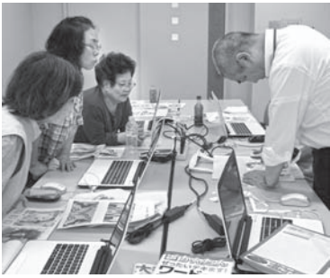
昨年のテーマは「トートバック作り」 今年のテーマは… お楽しみに!

パソコンの基礎から、ワード、エクセルを使用して文書や表、カレンダーや葉書など、オリジナル作品を作ってみませんか。パソコンをお持ちでない方も参加できます。