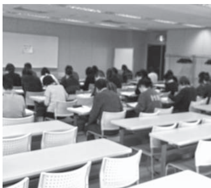
60分の筆記試験は、最後まで鉛筆の音が途絶えなかった。

2月21日(日)道民活動センタービルにおいて、2015年度全国統一要約筆記認定試験を実施しました。