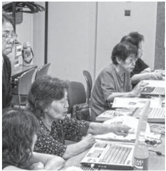
オリジナルうちわ作りが好評だった昨年度のパソコン教室の様子

※講習日程 いずれの日程も10時～15時 (休憩1時間) ※受講料 無料 ※各会場受講定員 10名程度 ※申込方法 開催の2ヵ月前に、開催地区及び近郊の協会へご案内を発送しますので、ご確認をお願いいたします。