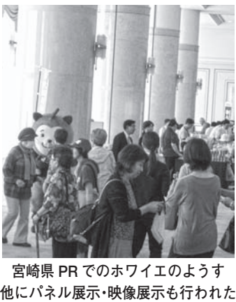
宮崎県PRでのハワイエの様子 他にパネル展示・映像展示も行われた