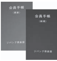
会員手帳 更新会員(左・色は緑)と 新規会員(右・色は赤)

期限を過ぎますと、割引率が新規会員扱いになりますので、お早めに更新手続きをお願いいたします。