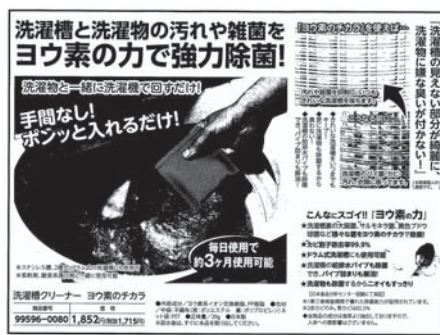
リピーター続出！ 「洗濯槽クリーナー ヨウ素のチカラ」

北海道身体障害者福祉協会では、独自の財源確保の一環としてインターネットで収益事業を立ち上げております。 収益金は身体障害者の福祉向上を目指す活動に有効に活用させていただきます。