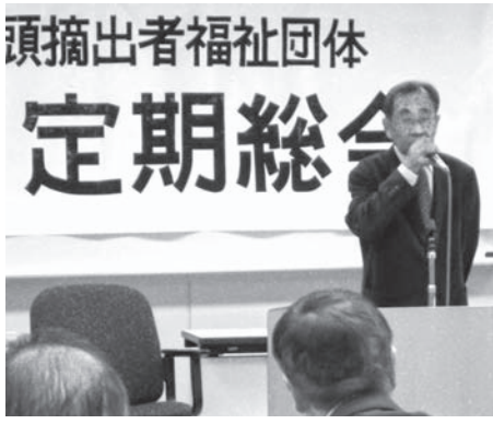
会長挨拶のようす

「奨学金を給付して頂きありがとうございます。おかげ様で毎月の学校への諸納金も滞りなく支払いができています。 学校生活では委員の仕事など積極的に行ったり、友達との会話を楽しんだり、有意義に過ごしている様です。 作業実習などのなかには、難しい事もある様ですが、少しずつ克服しています。 将来は『企業へ就職をして、しっかりと働いて一人暮らしをしたい』と本人は希望しております。 親としても、その様になってほしいと願っております。」 (原文のまま記載しておりますが、個人情報保護のため省略部分があります)