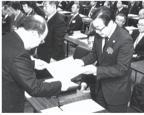
感謝状授与のようす

4月6日(月)、北海道新聞本社7階特別会議室において、公益財団法人北海道新聞社会福祉振興基金 創立50周年記念式典が開催され、その中で、当協会が感謝状をいただきました。