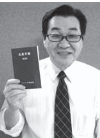
特別会員となった泉事務局長と新規手帳

【割引率】 新規会員 初回〜3回目↓2割引 4回目〜20回目↓3割引 更新会員 初回から3割引