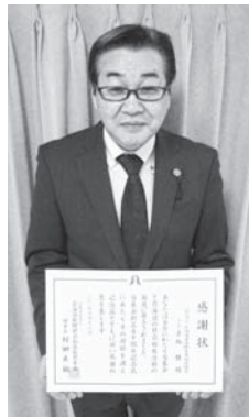
いただいた感謝状

これらの善意は、各種の助成事業、高校生などへの奨学金、社会福祉法人の設備整備への低利貸し付け事業に使われています。当協会では昭和56年より、基金の奨学金給付の申請受付から選考までの事務業務を行い、これまで1,450人を越える奨学生に給付することができました。