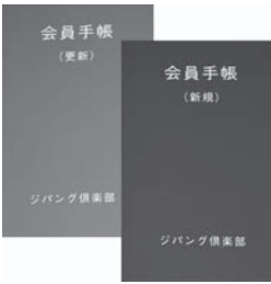
会員手帳 新規会員と更新会員

新規会員 【初回】3回目→2割引 【4回目】20回目→3割引 更新会員 【初回から3割引】