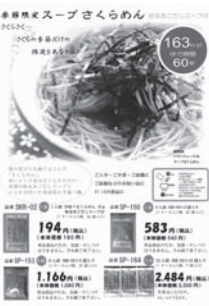
期間限定販売の「さくらうどん」

当協会は、独自の財源確保の一環としてインターネットで収益事業を立ち上げております。収益金は、身体障害者福祉向上をめざす活動に活用させていただきます。 詳細はインターネットで「北身協」と検索してください。 ご希望の方に、カタログを送付いたします。