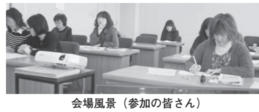
会場風景 (参加の皆さん)