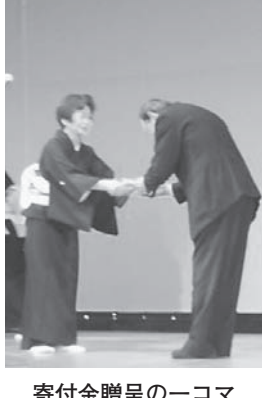
寄付金贈呈の一コマ