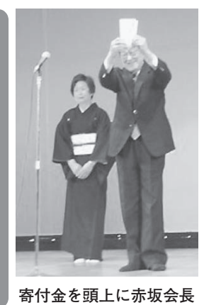
寄付金を頭上に赤坂会長