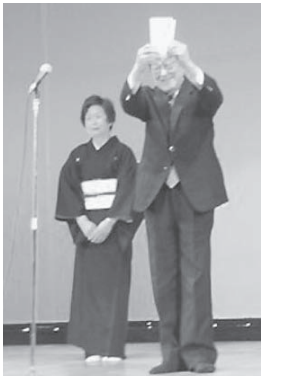
寄付金を頭上に赤坂会長