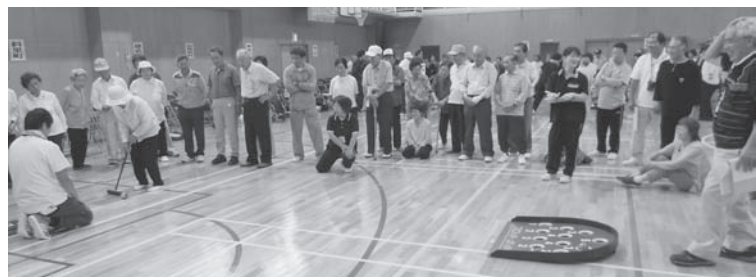
大会競技の一コマ